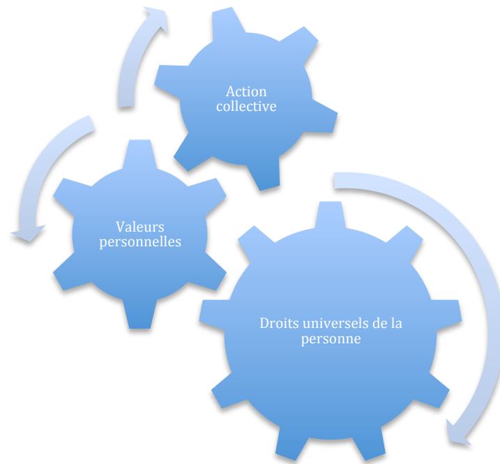
Figure 1 : Contextualiser le terrain d'entente

l'école, au travail et à la société civile sans devoir vivre dans un sorte de « placard » religieux ou culturel.